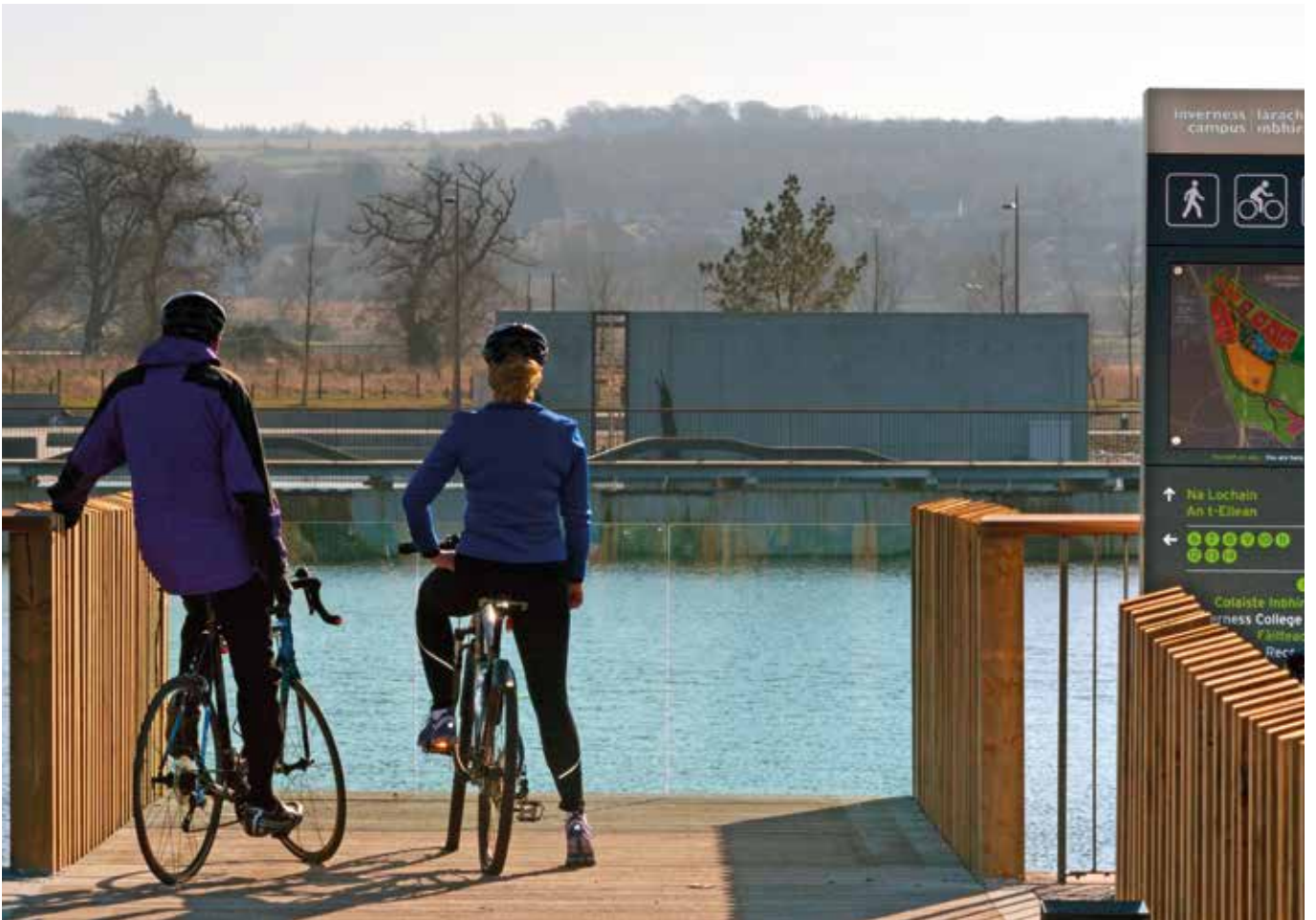
Làrach Inbhir Nis

Thuir còrr is leth de na gnothachasan is gnìomhachasan san t-suirbhidh gun robh Gàidhlig air a cleachdadh, no a' nochdadh, mar phrìomh eileamaid de phrìomh gnìomhan, stuthan no sheirbheisean na buidhne.