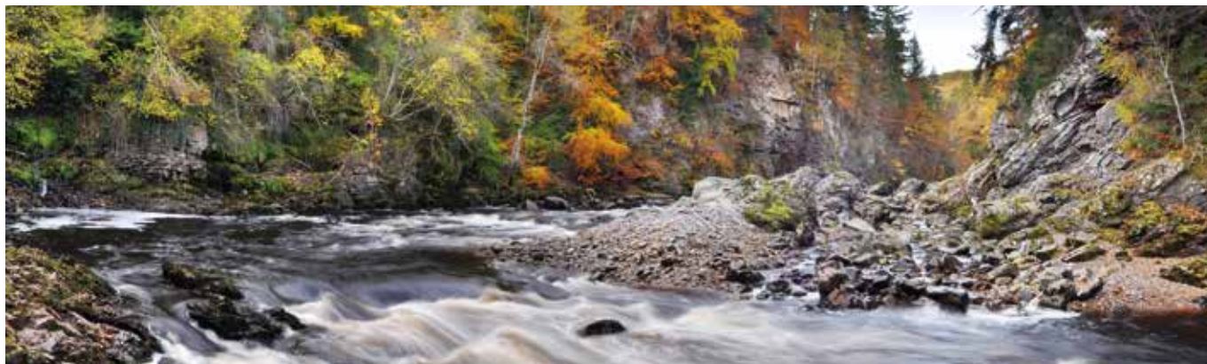
Abhainn Inbhir Èireann