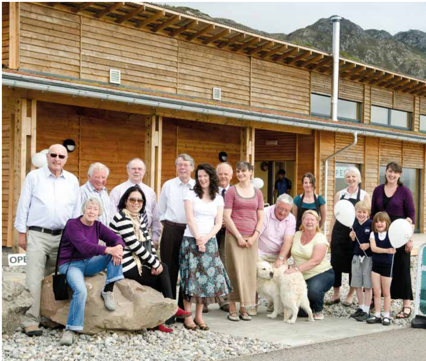
Fòram Gnìomh Gearrloch agus Loch Iùbh

NOTAICHEAN DO GHNÌOMHACHASAN IS IOMAIRTEAN